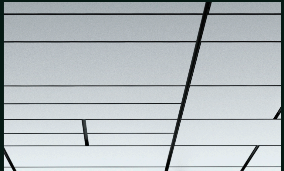
Entwerfen Sie Ihr eigenes Master Eg Design