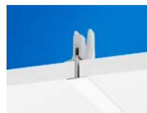
Profil główny Connect T24 C4 z klipsem Connect Hygiene