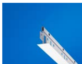
Profil główny Connect T24 C4

Profile główne Connect T24 C4 oraz profile poprzeczne Connect T24 C4 wykonane są ze specjalnej stali o wysokiej odporności na korozję, pokrytej zewnątrz galwanizowaną i powlekaną stalą w matowej bieli. Konstrukcja Connect C4 nie wymaga zabezpieczenia krawędzi po cięciu. Ecophon oferuje również dodatkowe profile i akcesoria w klasie antykorozyjnej C4.