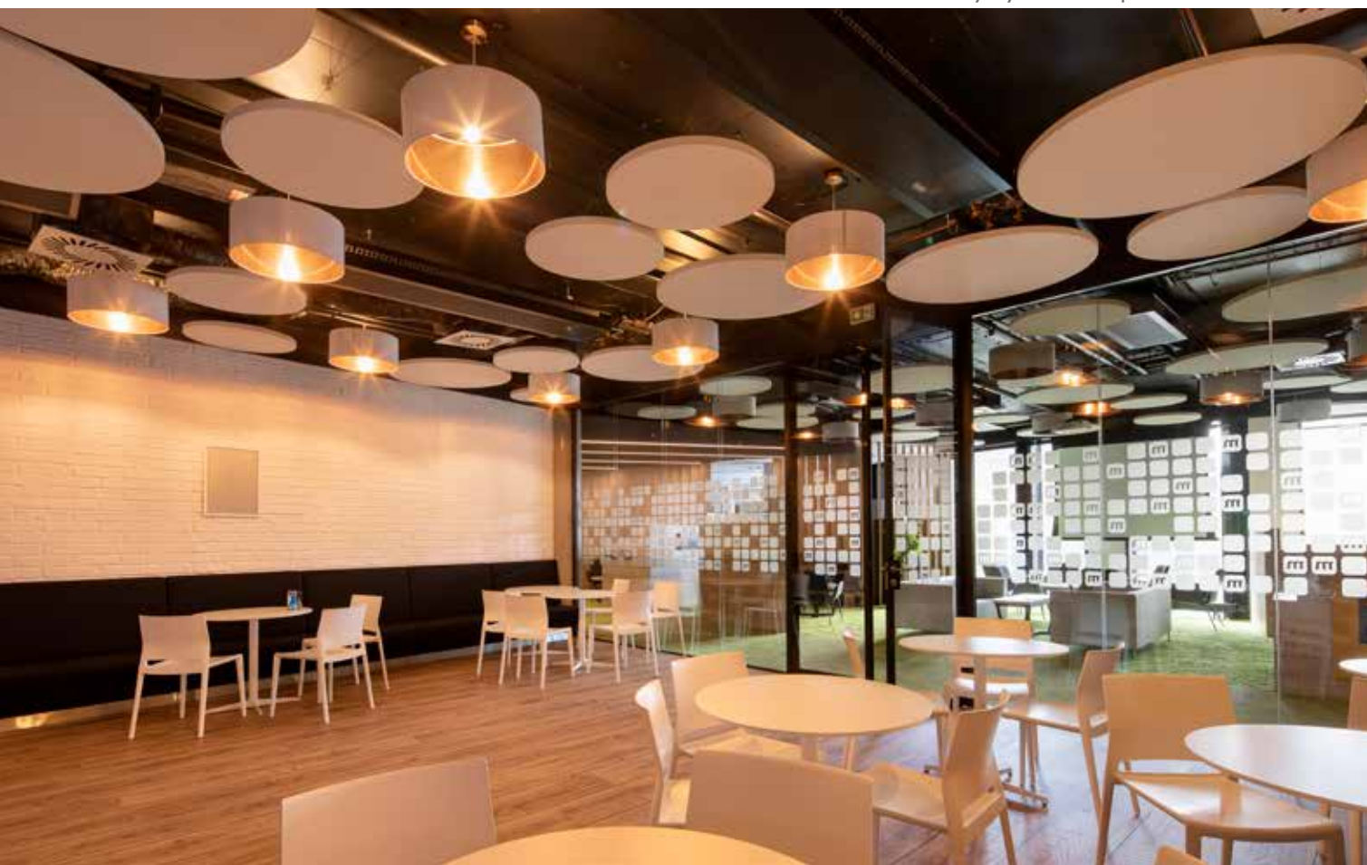
mBank S.A., Praha Architekt: Tétris Design & Build s.r.o. Akustický systém Ecophon Solo™ Circle ▼