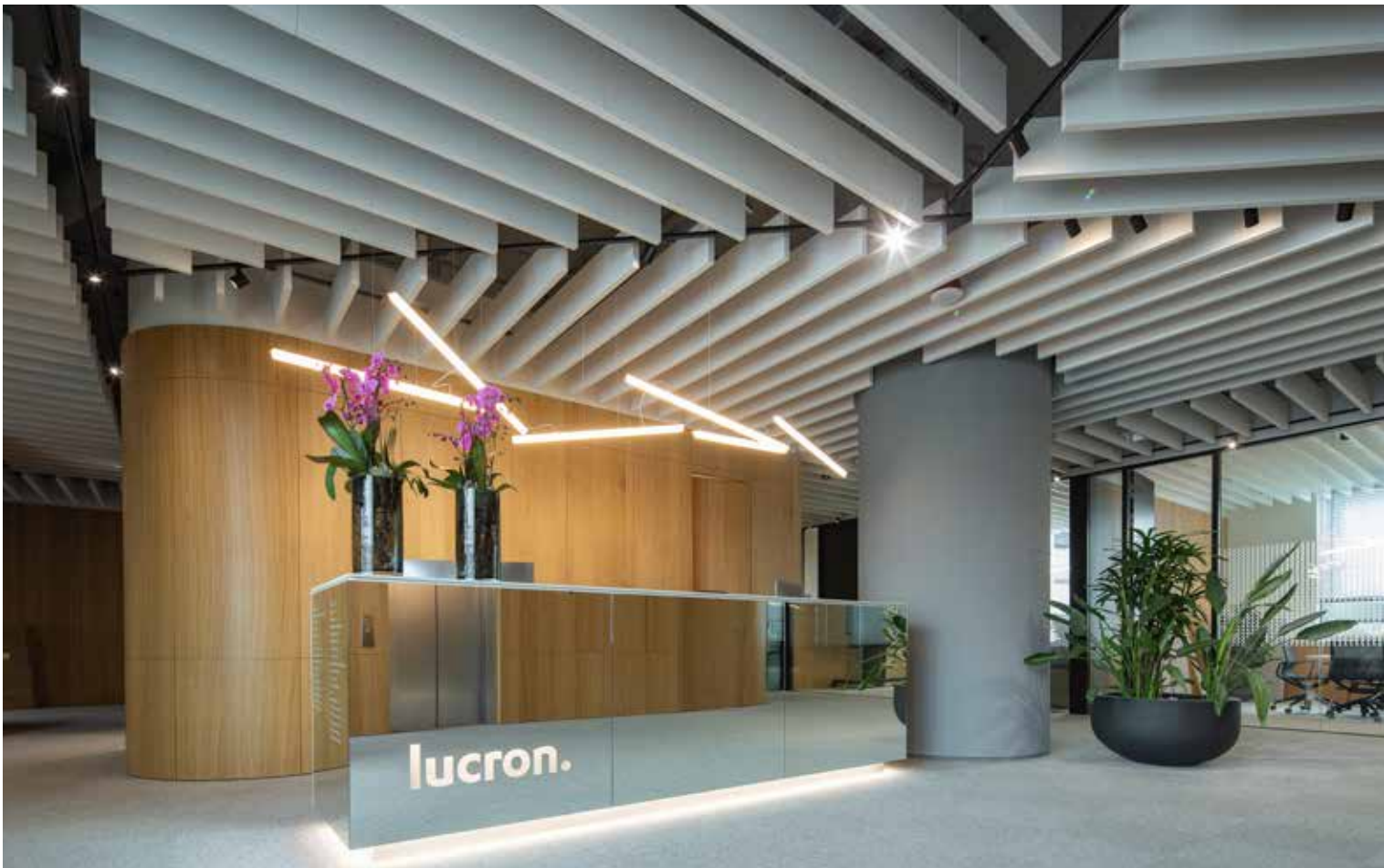
Lucron Group a.s., Bratislava Architekt: ČECHVALA ARCHITECTS Akustický systém Ecophon Solo™ Baffle ▼