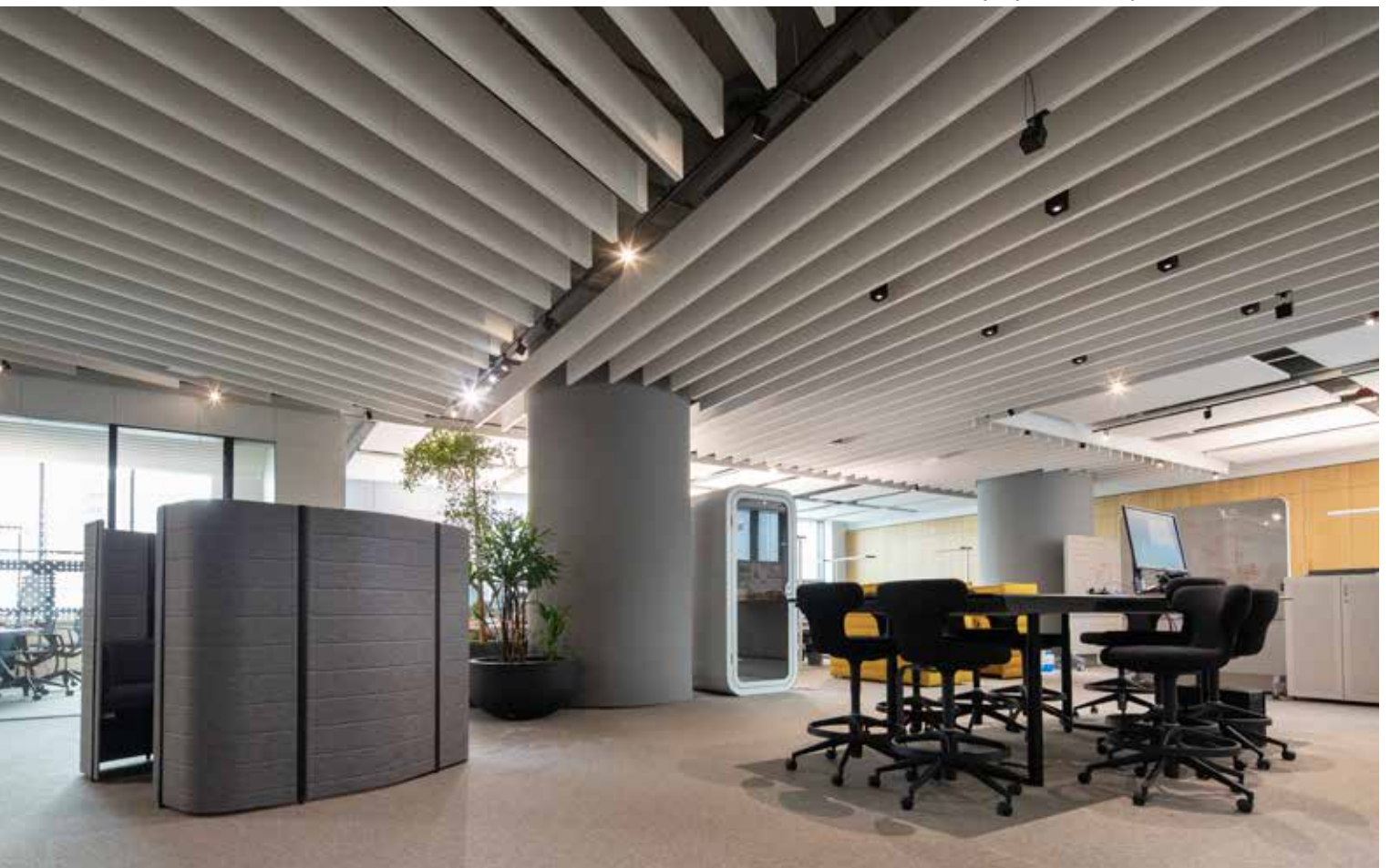
Lucron Group a.s., Bratislava Architekt: ČECHVALA ARCHITECTS Akustický systém Ecophon Solo™ Baffle ▼