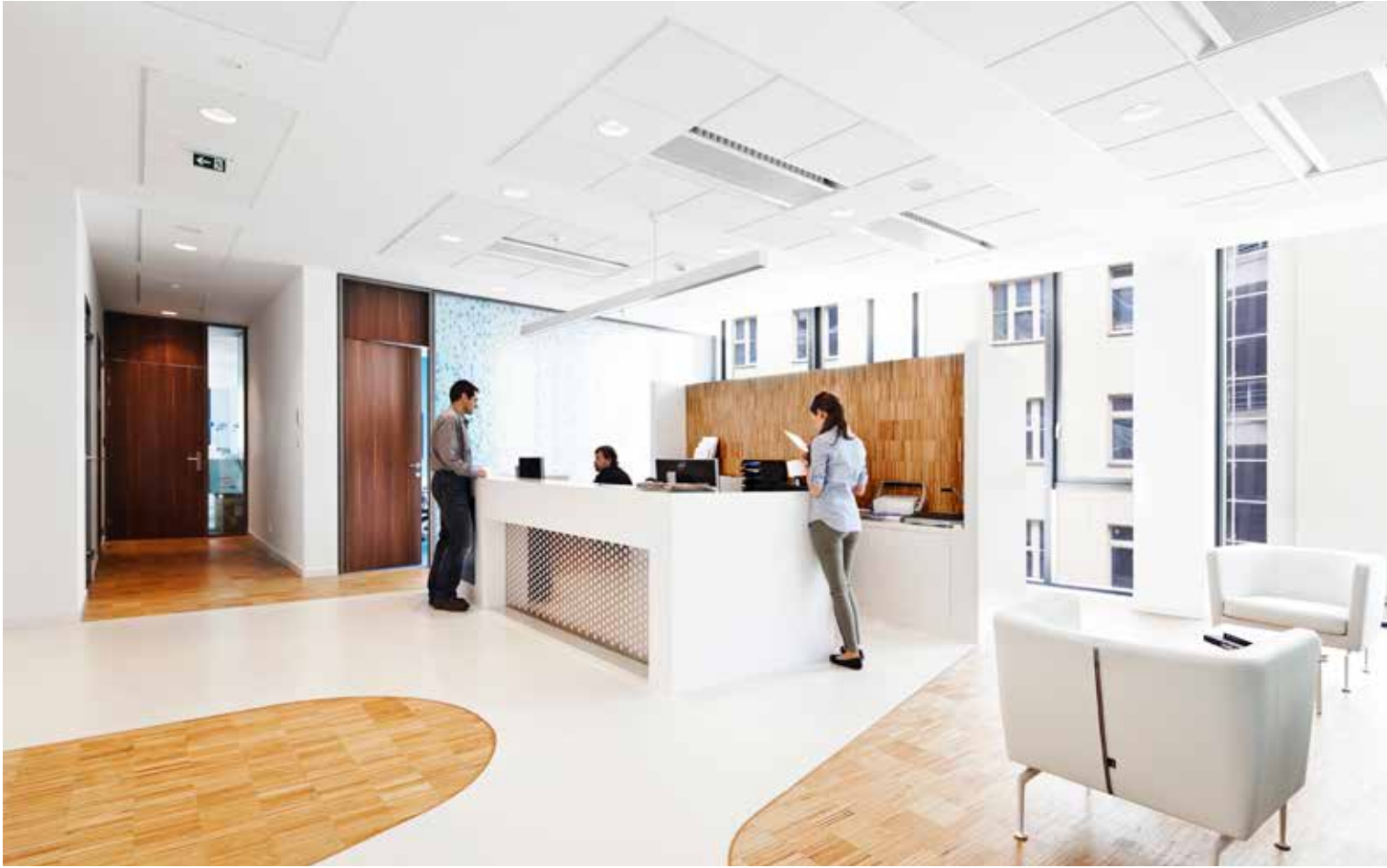
▲ RSJ a.s., Praha Architekt: YUAR s.r.o. Akustický systém Ecophon Focus™ E