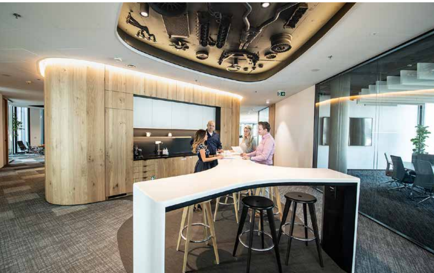
▲ ARVAL CZ s.r.o., Praha Architekt: Studio Perspektiv s.r.o. Akustický systém Ecophon Focus™ Ds