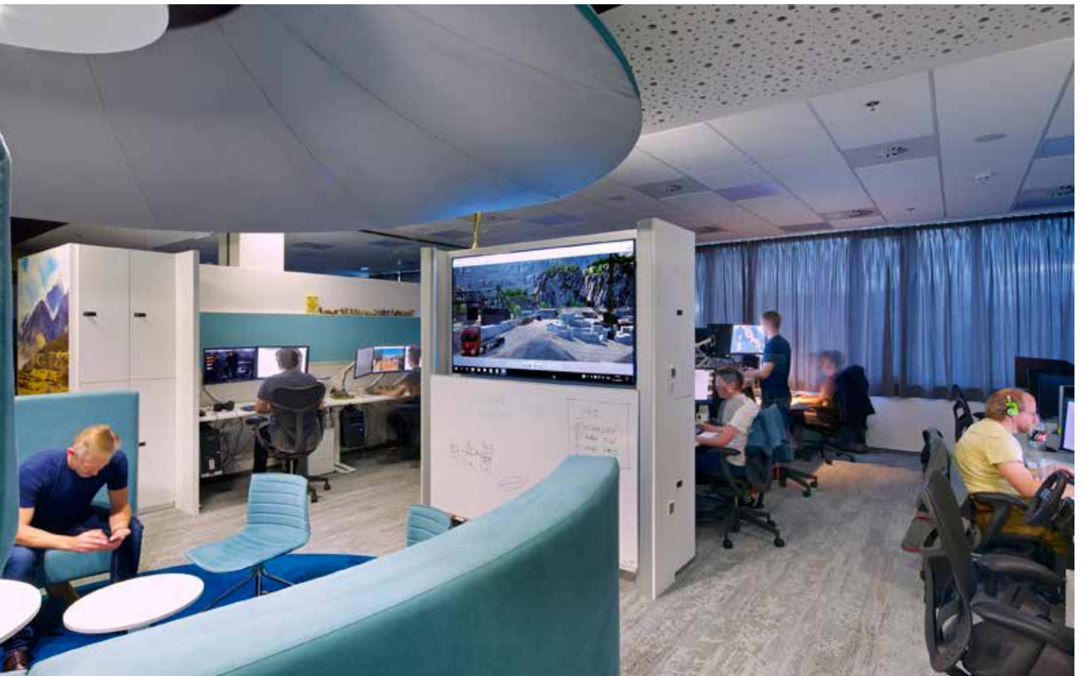
▲ SCS Software s.r.o., Praha, Architekt: Ian Bryan Architects s.r.o. Akustické systémy Ecophon Advantage™, Ecophon Akusto™ Wall