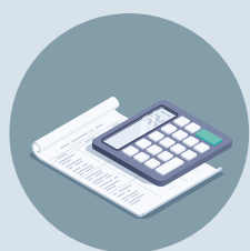
Estimat på klimatbesparing

Som ett led i detta arbete återvinner vi det material som blir över efter en installation eller vid nedmontering av akustikplattor som inte kan återbrukas. För att kunna bygga hållbart, tillhandahåller vi därför denna återvinningservice.