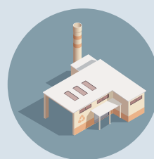
Återvinning av material