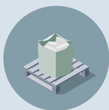
Insamling av material