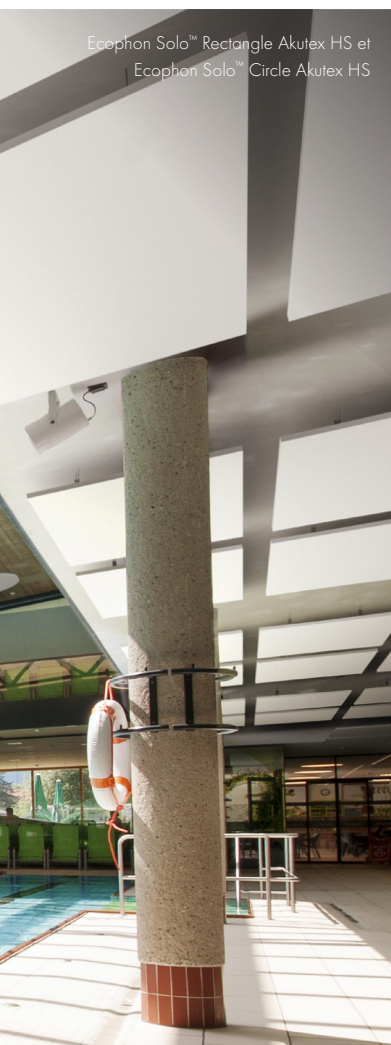
Ecophon Solo™ Rectangle Akutex HS et Ecophon Solo™ Circle Akutex HS