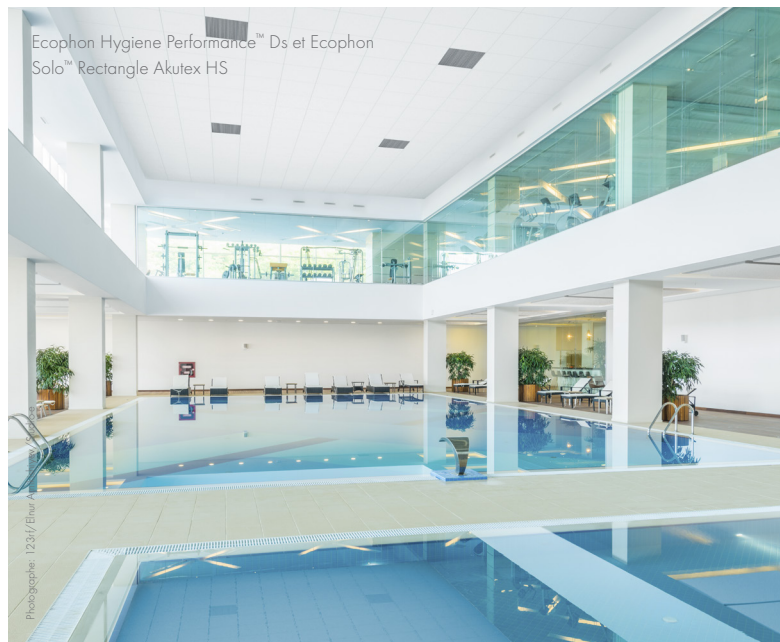
Ecophon Hygiene Performance™ Ds et Ecophon Solo™ Rectangle Akutex HS