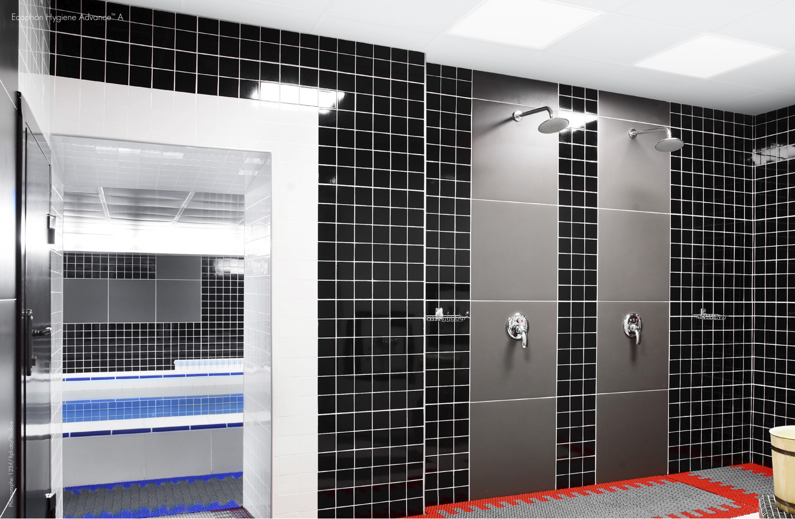
Ossatures et accessoires Connect C4 pour Ecophon Hygiene Performance™ Ds