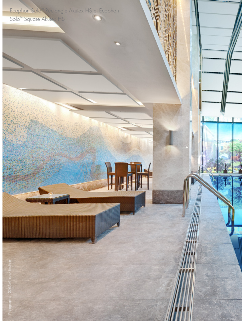
Photographie: J231/641 Lucie/Sudien